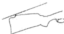
Monte Carlo stock