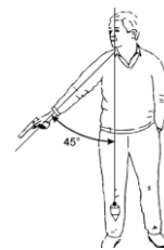
Färdigställning 8.7.2, 8.7.6.4h

INGA PISTOLER FÅR TAS FRÅN BANAN UNDER TÄVLINGEN UTAN TILLSTÅND FRÅN FUNKTIONÄRER SOM SKALL KONTROLLERA ATT PISTOLEN ÄR SÄKER.