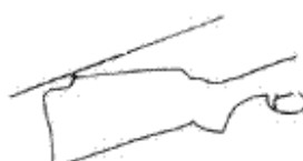
Monte Carlo stock