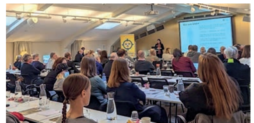
Bild från Årets Skytteforum som hölls i Bromma, Stockholm

Under året 2021 fanns det unga representanter i förbundsstyrelsen och i sektionerna; gevär, lerduva, pistol och viltmål. Efter två år av pandemi var det roligt och givande att träffa såväl nya som gamla ansikten under Skytteforum i november 2021. 14 ungdomar från olika delar av landet träffades och hade möjligheten att diskutera forumets frågor och ge ett ungdomsperspektiv. Ungdomarna kunde byta idéer och tankar med varandra för att lyfta såväl positiva delar, som utmaningar med att vara aktiv ungdom inom skyttesporten. Det fanns stor igenkänning och man kunde finna stöd i varandras erfarenheter mellan de olika sektionerna. Det här ger förhoppningar om ett tätare samarbete mellan ungdomarna i sektionerna inför år 2022.